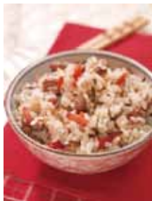
余った豆を使った炊き込みご飯♪

一年のしめくくりの節分の夜に、鬼を追い払い無病息災を願う。豆を撒き、撒かれた豆を自分の年の数だけ食べると、体が丈夫になり、風邪をひかないという習わしがあります。年の数だけの豆・・・1度に食べきれませんよね。余った節分豆(炒豆)は是非、料理に使ってください。普通の大豆より香ばしく火の通りも早く、おいしく食べられて吸収も良くなります。豆・ひじき・人参・醤油等を入れて炊飯するだけの簡単炊込みごはん。定番の煮豆でもよいですね。