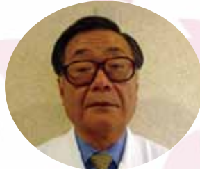
整形外科 丹羽 滋郎 (愛知医科大学名誉教授)