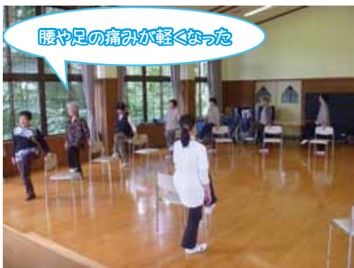
腰や足の痛みが軽くなった