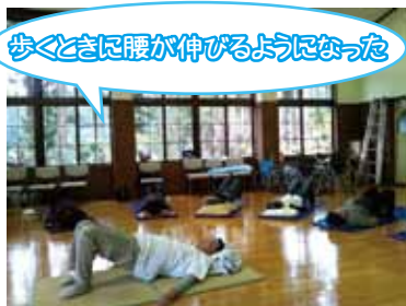
歩くときに腰が伸びるようになった

この地域の皆様が活き活きとした生活が送れるように、私たちと一緒に楽しく体を動かしてみませんか？ご参加お待ちしております。