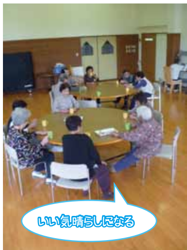
いい気持ちになる

現在は今まで行なっていた、座ってする・立ってする体操のほかに、最近では寝転んでできるストレッチや体操を理学療法士、作業療法士が紹介しています。寝転んでできる体操と聞くととても簡単のように思えますが、実際はスタッフ自身も「きつい」と感じるほどの運動です。この体操は主に体幹（胴体）を鍛えるもので、腰痛の軽減・予防に効果的です。また道具なども使わず手軽に行なう事ができるので、お家でも続けていただ